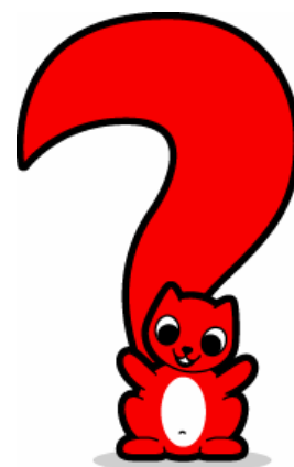
イメージキャラクターのリス (愛称は未定)