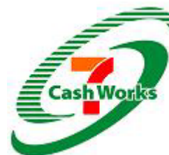
新会社ロゴマーク